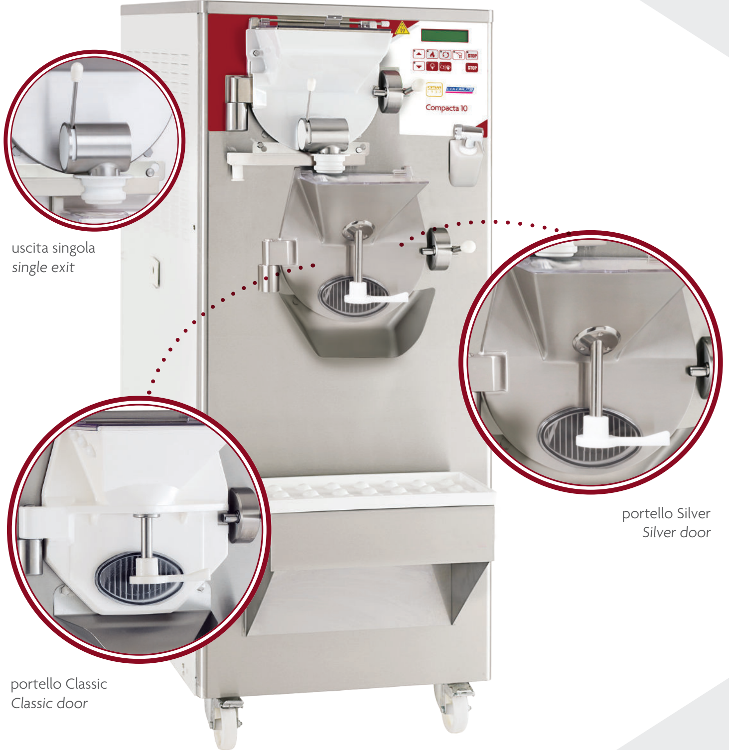
uscita singola single exit