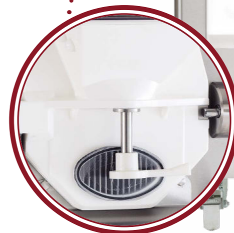
portello Classic Classic door