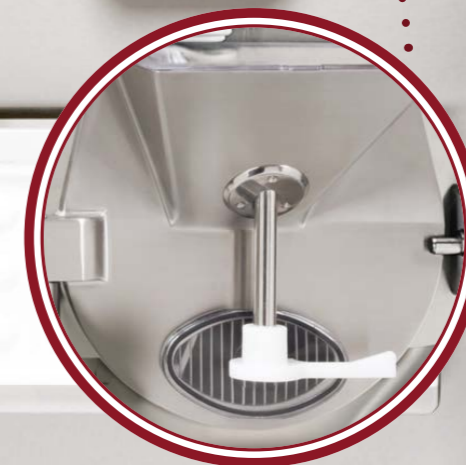
portello Silver Silver door