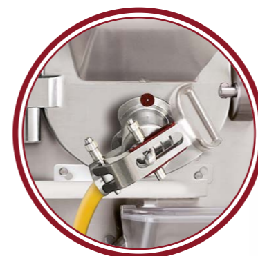
uscita laterale side exit

Compacta VariO - Il sistema Compacta VariO produce gelati dalla consistenza perfetta, sia con miscele ricche sia con miscele delicate, sia ai massimi regimi produttivi sia con cariche ridotte a quantità minime. Compacta VariO - The Compacta VariO system always makes gelato with perfect consistency, both for rich and delicate mixes, at maximum production and minimum capacity.