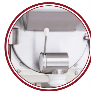
uscita singola single exit