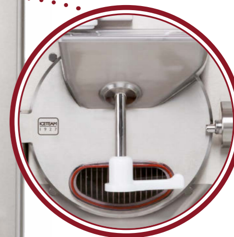
portello Elite Elite door